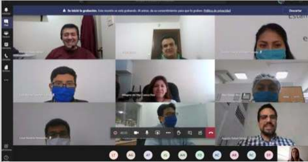
San Miguel Fruits S.A