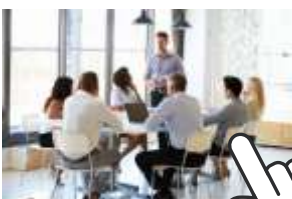
BASC PERÚ: V Encuentro de Auditores Internos BASC V Encuentro de Auditores Internos BASC