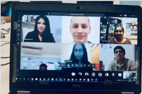
DSM MARINE LIPIDS PERÚ S.A.C (sede Piura)